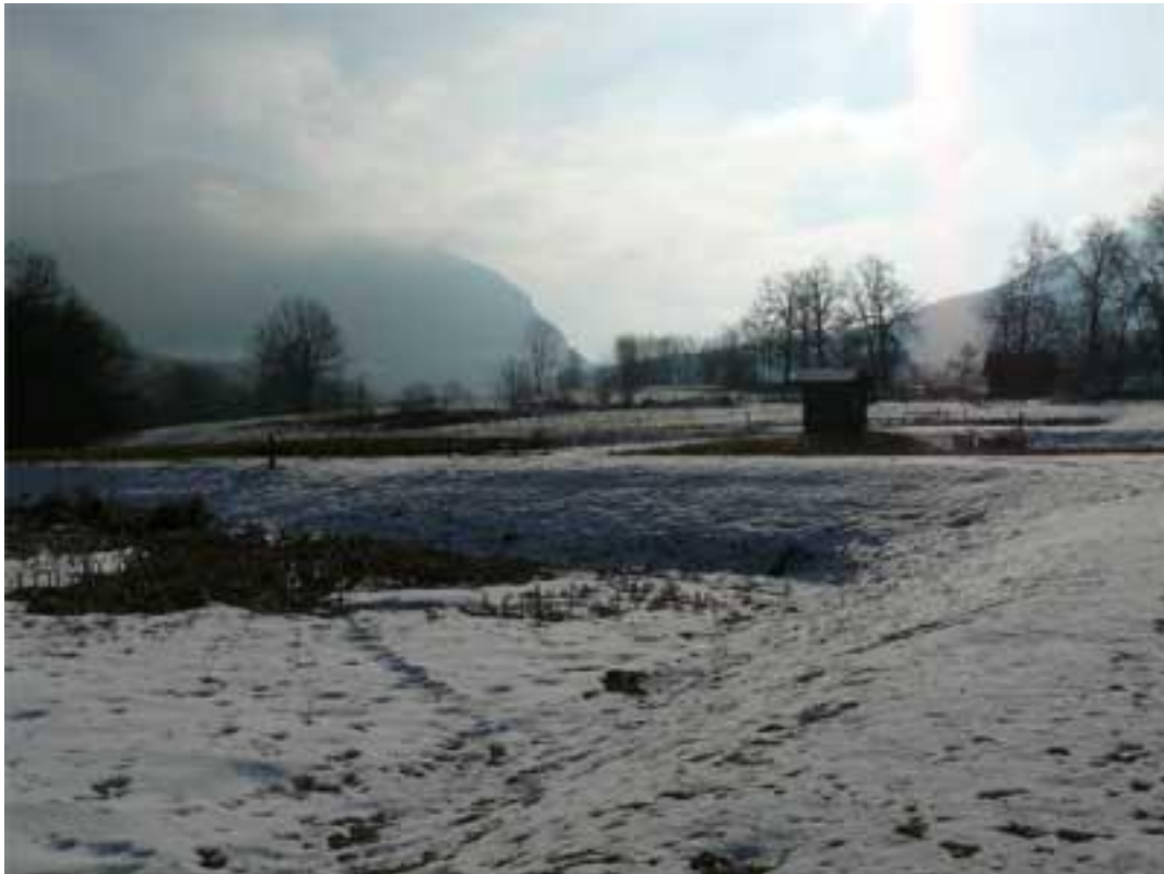
Figure 2 : Station d'épuration à filtres plantés de roseaux de Curienne (Savoie)